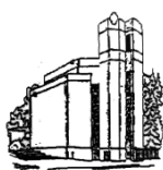
St. Simeon Trier-West