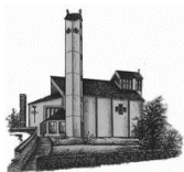
St. Martinus Trier-Zewen